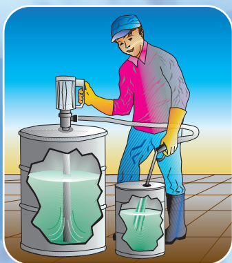
TO Motore elettrico - Electric motor

V. 220 Kw 0.25 n° g/min. - RPM 2800 PESO: Kg 6 CONSUMO: Nmc/min. 0,5